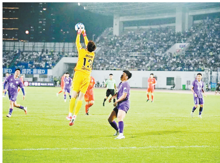
1场闽超队伍与台湾地区城市球队的专项交流赛,聚焦两岸体育深度合作。

系列交流活动将安排在赛事中期窗口期及总决赛结束后开展,同步配套相关交流互动活动,让两岸同胞以球交友、以情连心,深度互学互鉴足球文化,厚植两岸家国情怀与同胞情谊。