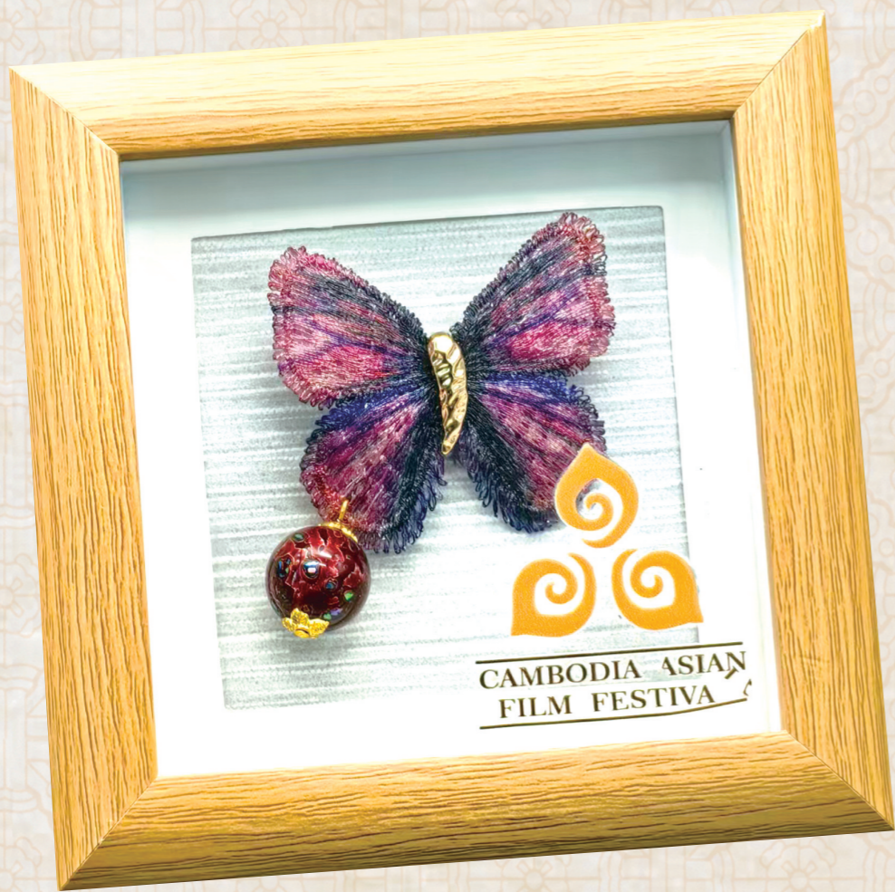
▲《蝶舞翩翩》(双面蚕丝刺绣+大漆双非遗)

大漆,是流淌在中华文明血脉里的颜色。这抹取自自然、历经千磨万漆的东方瑰宝,始终以温润而坚韧的姿态,承载着中国人的审美与匠心。